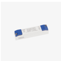
Driver ON-OFF 500mA 2,5-5W 200-240V Ref. 4.1032.1103