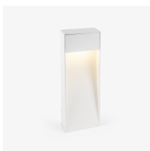
Versión en blanco