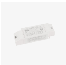
Driver DALI & PUSH 150-1050mA 8-42W 220-240V Ref. 4.1069.6102